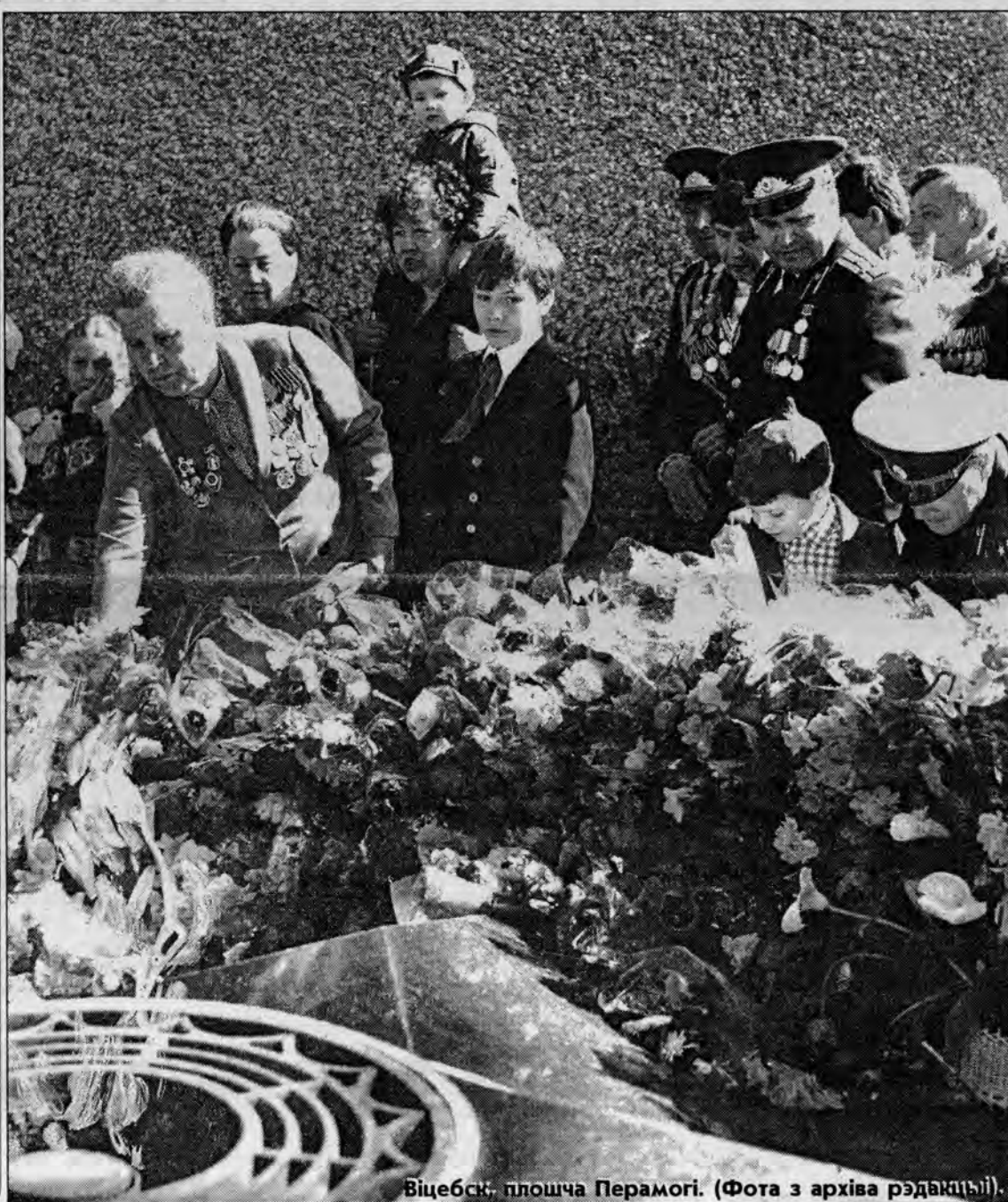
Віцебск, плошча Перамогі. (Фота з архіва рэдакцыі).