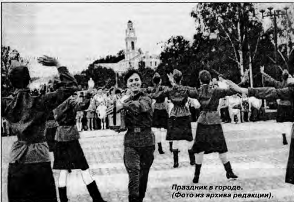
Праздник в городе.