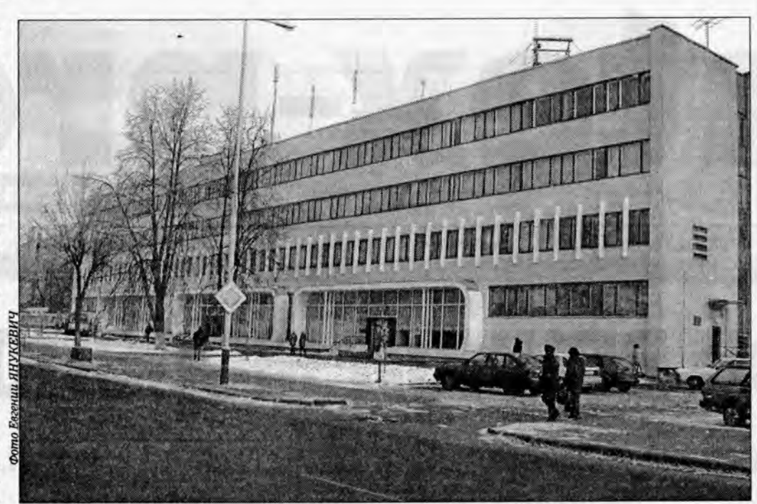
• Нарушения были выявлены и в Барановичском РУПСе

Проверка же Барановичского районного узла почтовой связи установила, что предприятие в январе - марте 2003 года при реализации промышленных товаров (шкафов абонентских 4-секционных, телефонного аппарата,