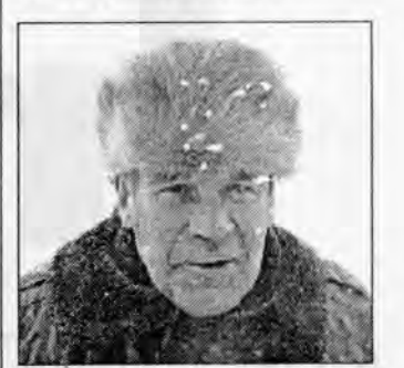
Борис Иосифович, пен-

профилактические меры протил гриппа вы примоняете?