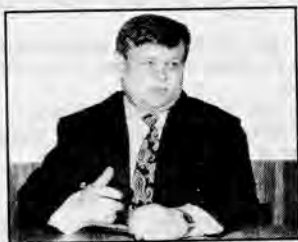
заместителем председателя Брестского облисполкома, председателем комитета по экономике и рыночным отношениям Владимиром Степановым.