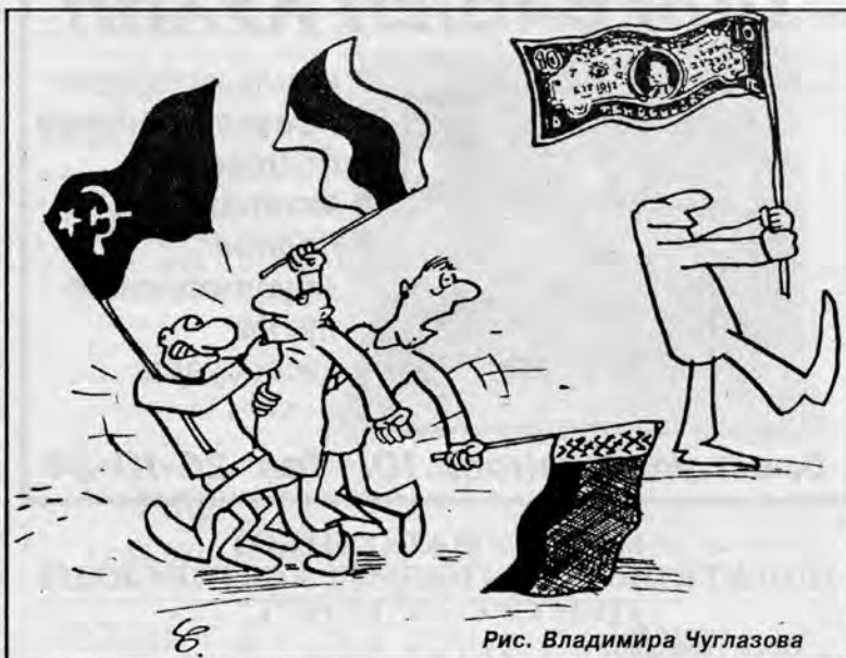
Рис. Владимира Чуглазова

— Отказ белорусскому президенту в возможности