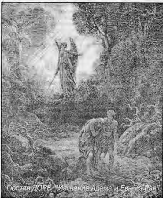
Густав Доре. "Изгнание Адама и Евы из Рая"

Просмотрите внимательно первую книгу Моисея. Вы не увидите и намека на то, что человек родился бессмертным, но стал таким по причине своего послушания — предательства. Не сказано также, что он родился смертным. Но вполне ясно говорится о двух деревьях: жизни и смерти. Значит, в книге нам дают понять: за человеком был выбор, ему была дана возможность выбирать. Древо жизни не было запретным; стало только протянуть руку, сорвать плод, вкусить его и стать бессмертным. Господь Бог даже