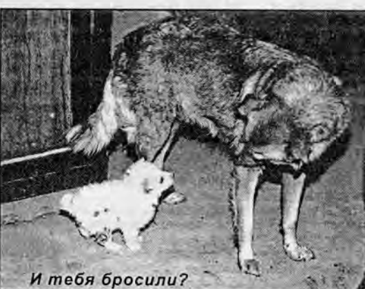
И тебя бросили?

РАЗУМ И СОВЕСТЬ НЕ МОГУТ БЫТЬ ЛИШЕНЫ СВОИХ ПРАВ. ИМ МОЖНО НА- ЛГАТЬ, НО ИХ НЕЛЬЗЯ ОБМАНУТЬ.