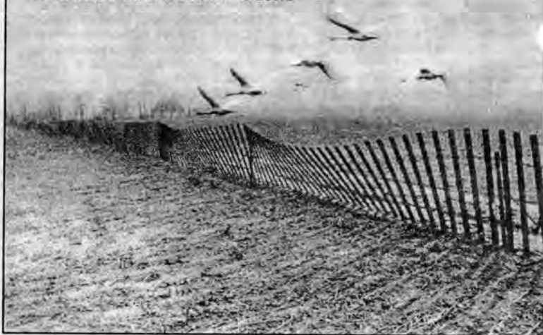
Фото Б. Розенгист "Осень"