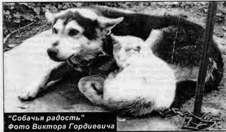
"Собачья радость"