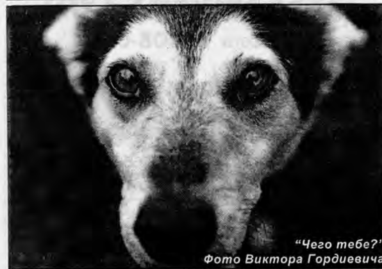
"Чего тебе?"