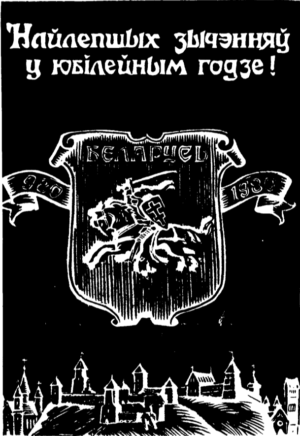
Clandestine commemorative card from the Russian (Soviet)-occupied Byelorussia to mark 1000 years of Byelorussian history.

state in existence (on less than two thirds of the Byelorussian ethnographic territory) in which the people are summarily deprived of their human rights - political, social, cultural, and religious; the Byelorussian language itself has been banned from its government, from many schools, and from our cities. But we know also that the struggle for a free and independent Byelorussia goes on unabated. The Russian reign of terror cannot stop us - our brave people will never capitulate. That is the lesson of the thousand years of our history and that's the deeper meaning of the message of the jubilee postcard to which our answer is: "Brothers, you may always count on us." - P. Mankouski