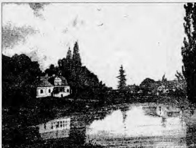
Сядзіба Верашчакаў у Туганавічах.

родным краі знаходзіў не толькі задавальненне, а яшчэ больш адкрываў для сябе радзіму, яе людзей, характава іх душы і памкненні.