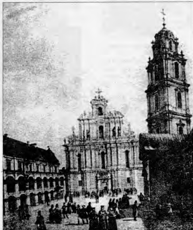
Віленскі ўніверсітэт, дзе вучыўся Адам Міцкевіч.

Марыля даводзілася стрыечнай сястрой Ігнату Дамейку і была ўсяго на адзін год маладзейшая за Адама. Яна цудоўна іграла на розных музычных інструментах, добра спявала, ведала беларускую, рускую, французскую, нямецкую, італьянскую мовы і латынь, чытала Вальтэра, Русо, Гётэ. Пісала і дэкла-