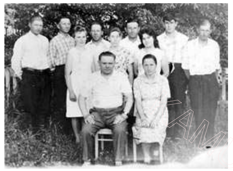
3 класным кіраўніком і выпускнікамі 10-га класа вячэрняй школы пры Зубелевіцкай сямігодцы. 1967 г.