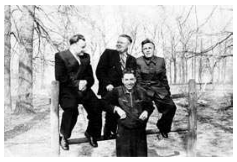
3 педагогамі Пранчакоўскай школы (у цэнтры). 1958 г.