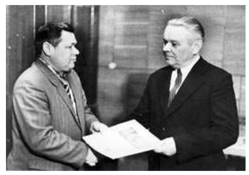
Уручэнне ганаровай граматы як пераможцу конкурсу раённай газеты «Будаўнік камунізму» на лепшы нарыс пра людзей калгаснай вёскі. 1970 г.