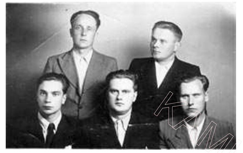
Студэнт-завочнік Мінскага педагагічнага інстытута (уверсе справа) з аднакурснікамі (1953–1956 гг.)