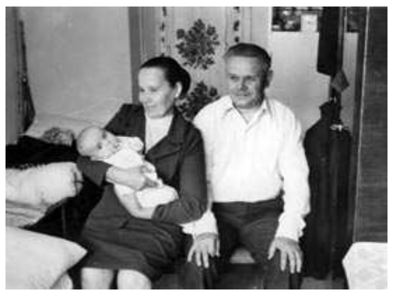
3 жонкай Яўгеніяй і ўнукам. 1970 г.