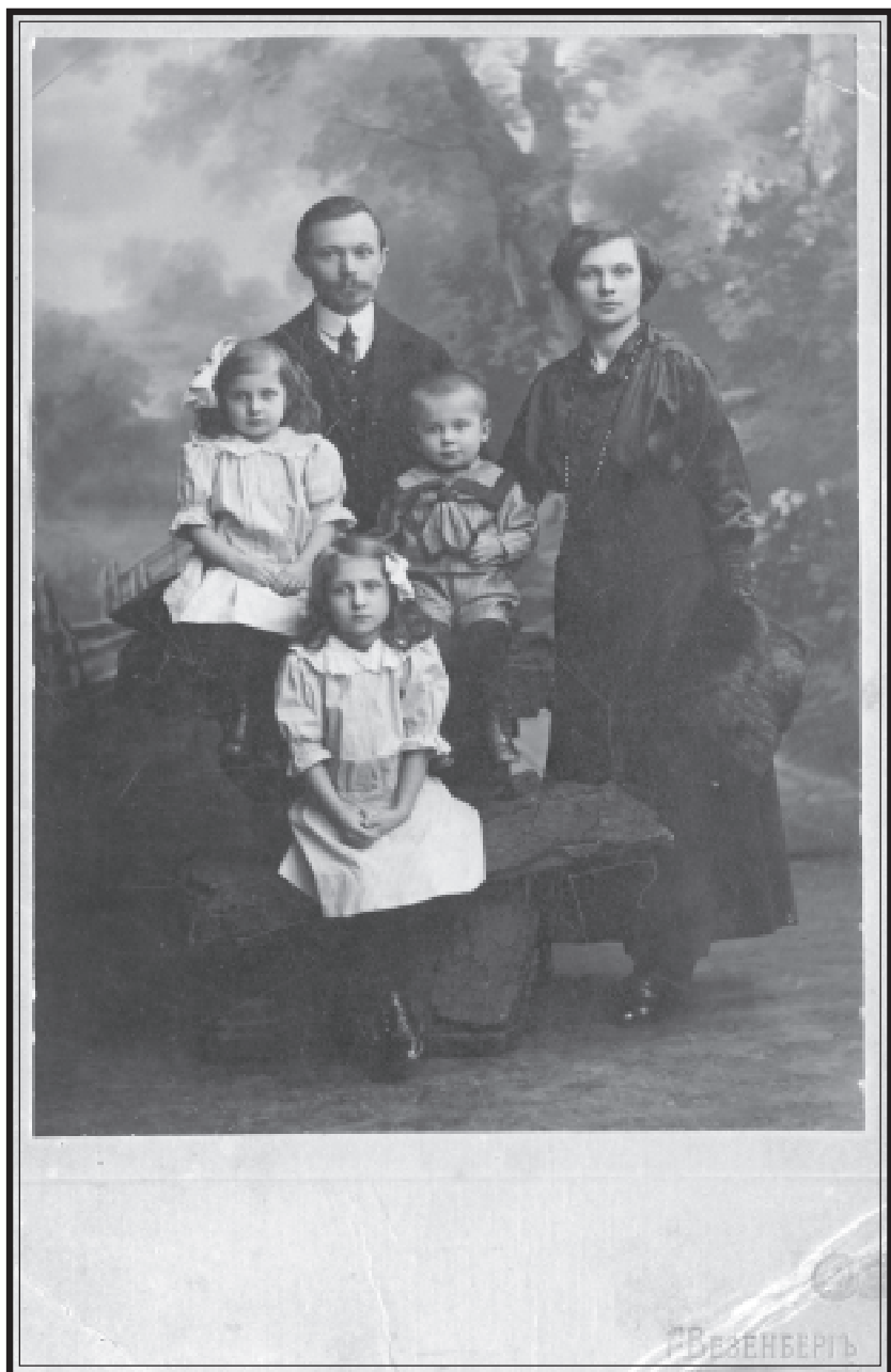
1. Сямейства Будзькаў. 1915 г. Петраград.