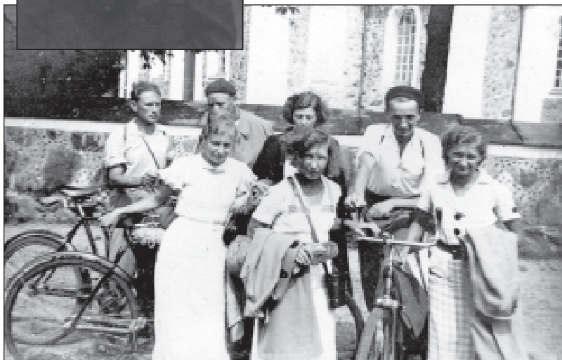
13. Група экскурсантаў Беларускага студэнцкага саюза падчас экскурсіі ў Налібоцкую пушчу. Вялеўка. 1937 г.