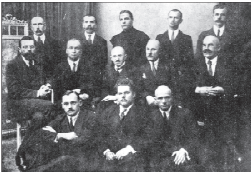
19. Паслы і сенатары Беларускага пасольскага клуба.