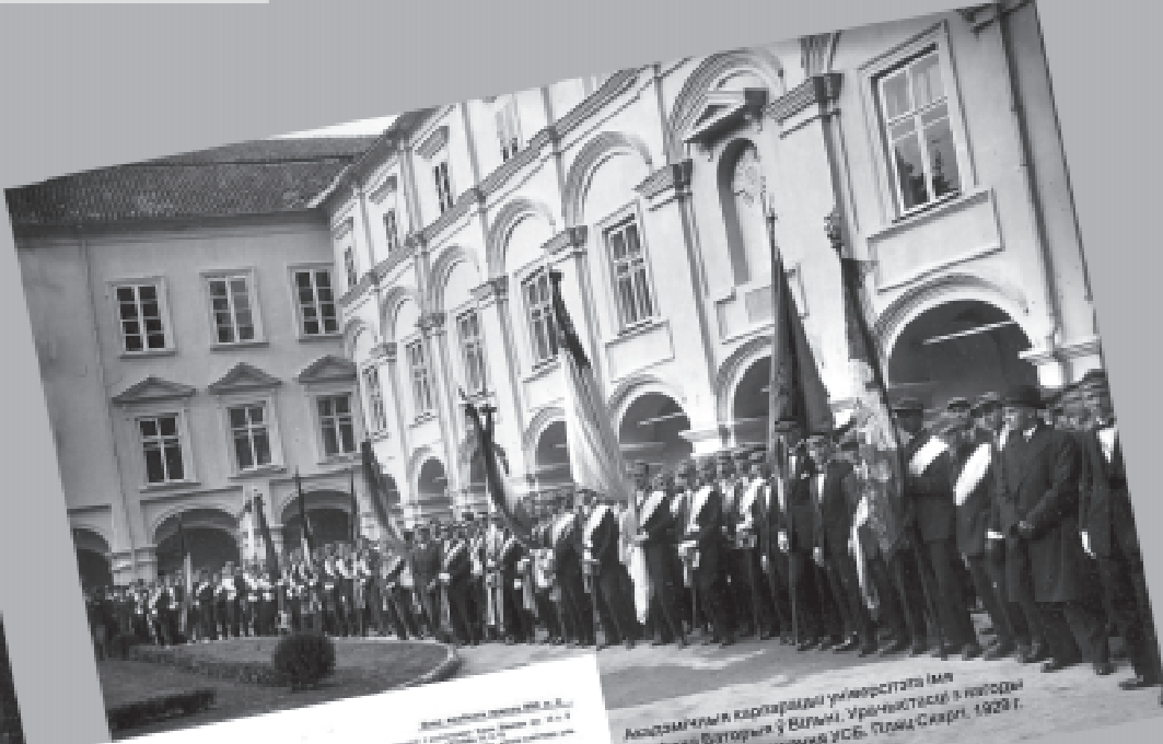
Академічныя карпаратыўны ўніверсітэты Імя Сяфрана Вятарыка ў Вільні, Ірэнчэўскасі і калонды 10-гадова ўніверсітэты УСБ, Пільна Скарці, 1929 г.