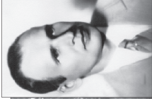
32. Михайл Забойда-Суміцькі, оперни спявак Мілганскай Г Познаньскай оперы.