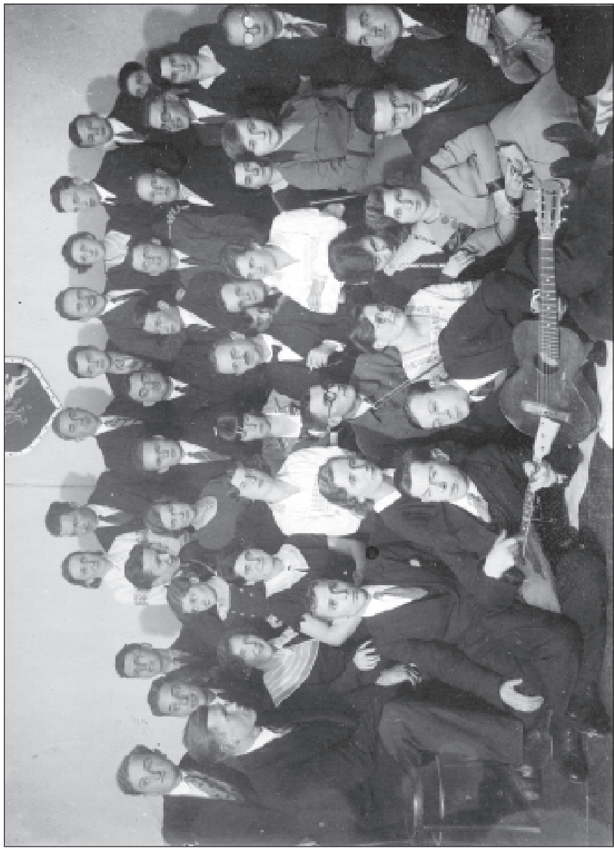
14. Беларускі студэнцкі саюз. 1931–1933 гг.