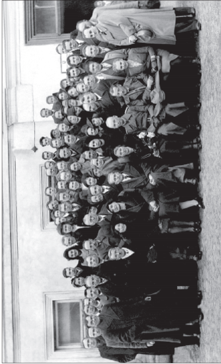
37. 25 год Беларуская Віленская Гімназія. Капектыўны здымак былых навучэнцаў і выкладчыкаў гэтай установы. 1944 г.