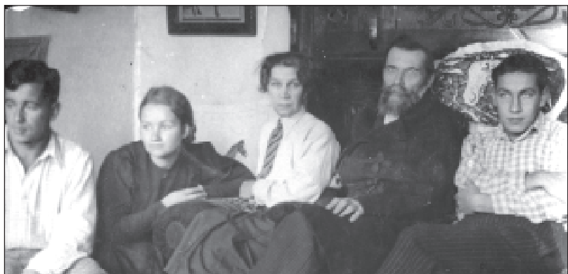
17. Сямейства Багдановічаў.