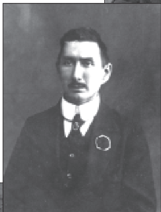
12. Іван Луцкевіч. 1918 г. У час беларускага канцэрта ў Вільні.