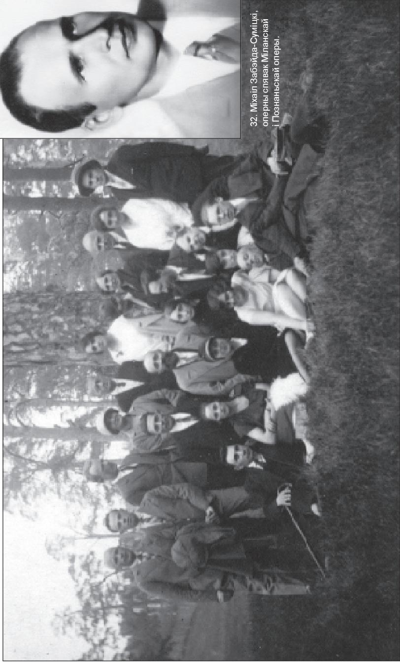
31. Вільня. Пікнік "Грамадоўцаў". 9.VI.1929 г.