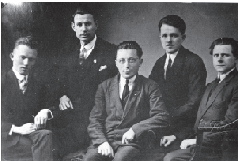
23. Віленская беларуская інтэлігенцыя.