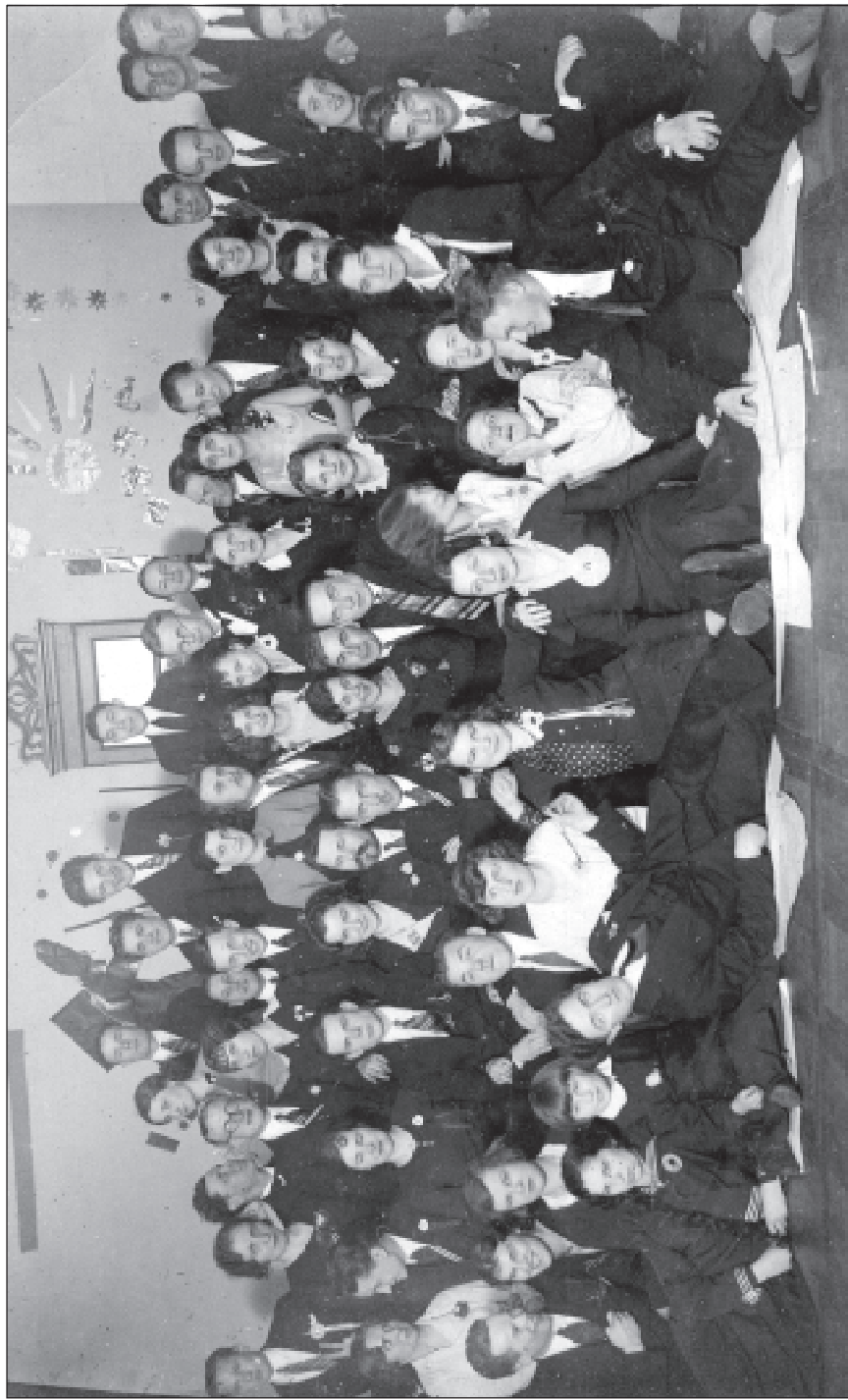
27. Беларускі студэнцкі саюз. 1933 г.