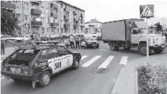
Столкнулся VW-Polo и ГАЗ-53