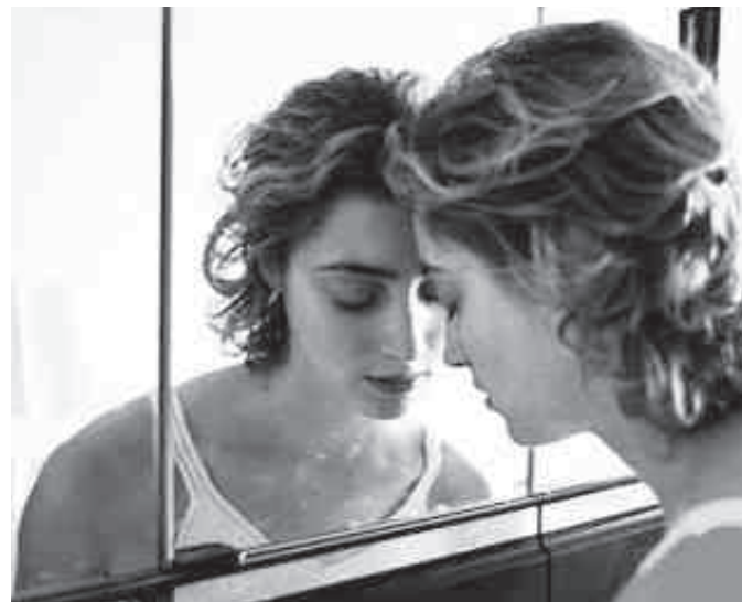
Когда жизнь кажется невыносимой

«Самоубийство и уныние — это все о депрессивном состоянии, — говорит психотерапевт. — И у нас действительно депрессивная нация. Это определяют личностные, психологические и социальные факторы. Это целый конгломерат, очень объемный процесс, в результате меняется фон и снижается настроение. Государству очень выгодно держать людей в депрессивном состоянии. Потому что когда человек чувствует себя жертвой, это состояние его парализует, он уже ничего не хочет де-