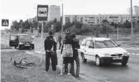
В ДТП пострадал велосипедист