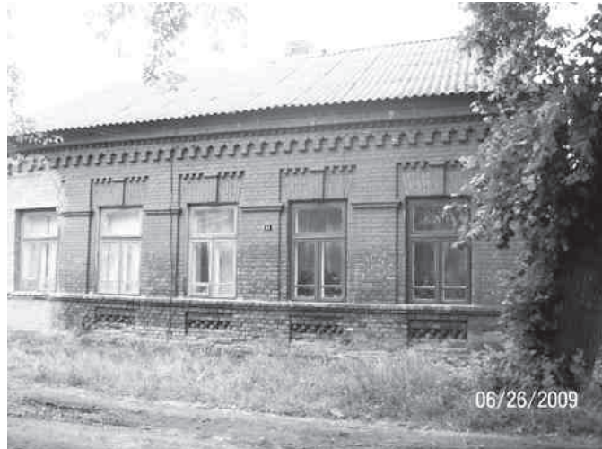
Этого дома скоро не станет небольшой кварталчик.

Местная еврейская община пыталась и пытается принимать меры по сохранению предместья, однако на активные действия не отважилась. Были направлены обращения к властям всех уровней. На эти обращения активисты получили обещания, что разрушать будут, но точно и аккуратно. И вот сейчас «точечно» уничтожен