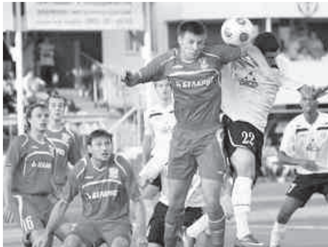
МТЗ-РИПО проиграл донецкому «Металлургу»