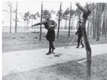
Любимая игра военных того времени — городки