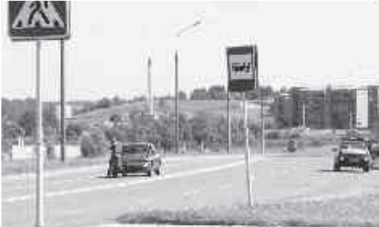
Не удалось избежать столкновения автомобилю KIA