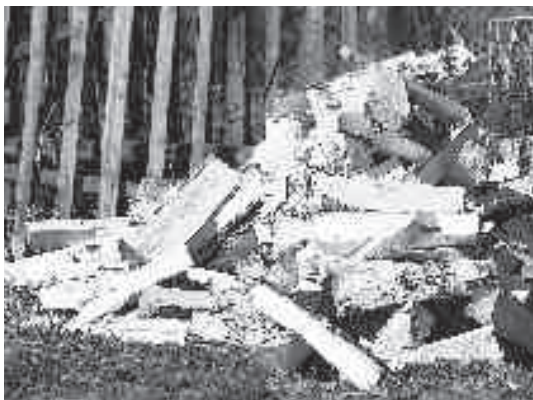
Найлепшыя — бярозавыя дрывы

Гаспадары і гаспадыні прыватных дамоў ужо цяпер клапаціцца, каб ацяпліць сваё жытло на зіму. А на фоне падавання газу альтэрнатыўныя віды паліва набываюць яшчэ большую актуальнасць.