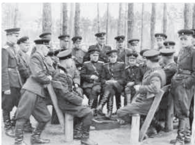
Во время перерыва в занятиях

Однажды на дамбе нам повстречался пьяный полковник. Человечек шел зигзагом по широкой дорожке. Мы проводили его взглядом, боясь, что он свалится в воду. Посмотрев вслед бравому вояке, отец только печально сказал: «В наше время пьяного лейтенанта на улице не встретил бы, а теперь — полковники зигзагом ходят». Конечно, это было исключение из правил, в том смысле, что полковник оказался один. Чаще этих ребят, если в этом есть необходимость, молодые офицеры доводят под белы ручки к самим дверям квартиры и передают на попечение любимой жены. Пусть не бегут мои дорогие нынешние оппоненты с жалобами и опроверже-