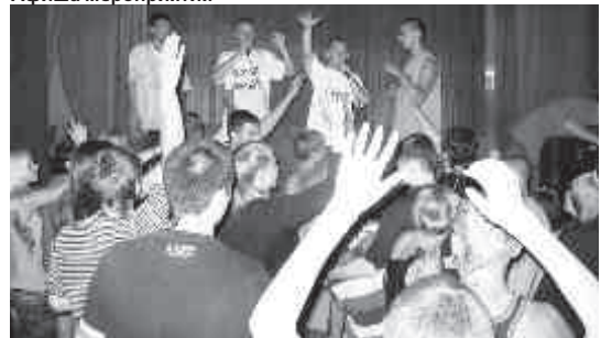
Во время концерта

гонники). Поэтому и название вечеринки с явным сарказмом на эту тему.