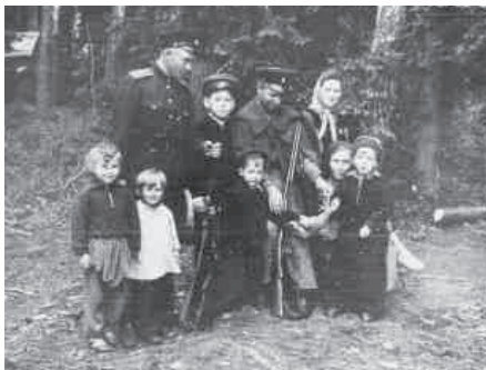
Офицеры дивизии на отдыхе с семьями, 1960г.